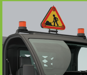
Dachträger + Warnleuchte, -Dreieck