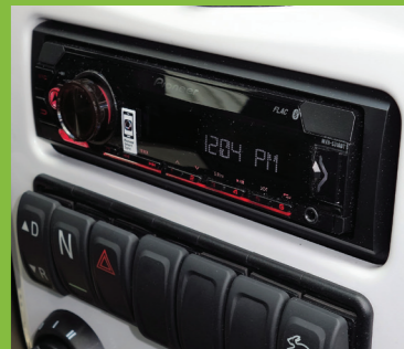
Bluetooth Radio + 2 Lautsprecher