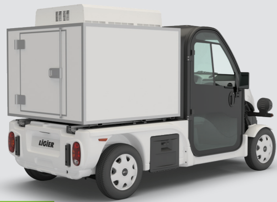
1 LKW mit isoliertem / gekühltem Aufbau