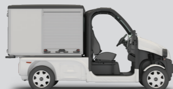
PULSE 4 - LANG