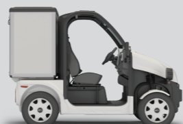
PULSE 4 - KURZ