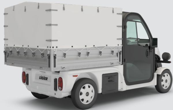
4 Ladefläche + Plane