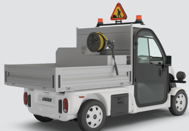
6 Hochdruck Reiniger 130 bar - 200L Tank