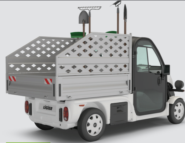
3 3 Bordwände + Aluminium Aufbau und Gerätehalter