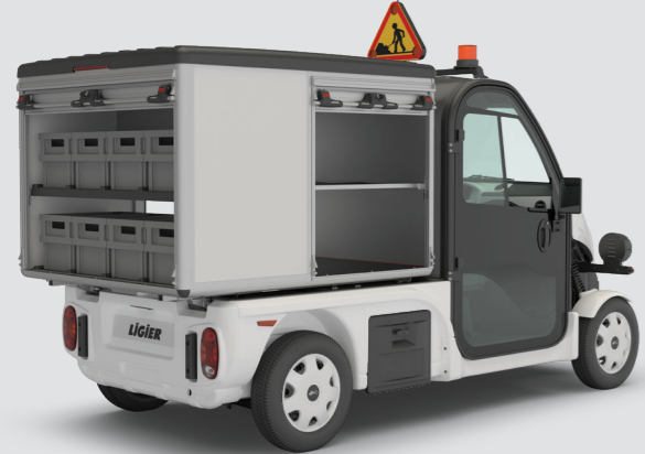
8 LKW mit Rollladen: rechts und/oder links und/oder hinten