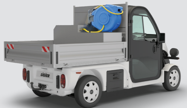
5 Ladefläche + Niederdruck Sprinkler und Sprühsystem umfasst: 200L Tank, 15m Schlauch, Teleskop-Stab mit Düse, Pumpe