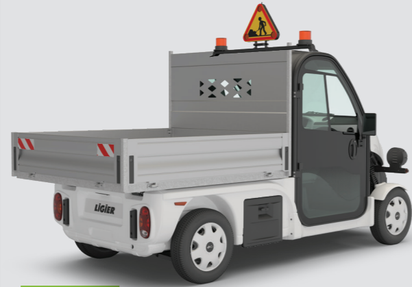
2 Feste Ladefläche oder Kipper mit Hydraulik 3 abklappbare Bordwände